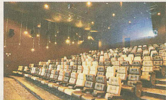
■影院內同樣是以黑白為主調，感覺強烈，卻有種家的溫暖感。