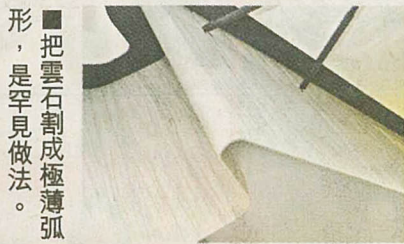
■把雲石割成極薄薄片，是罕見做法。