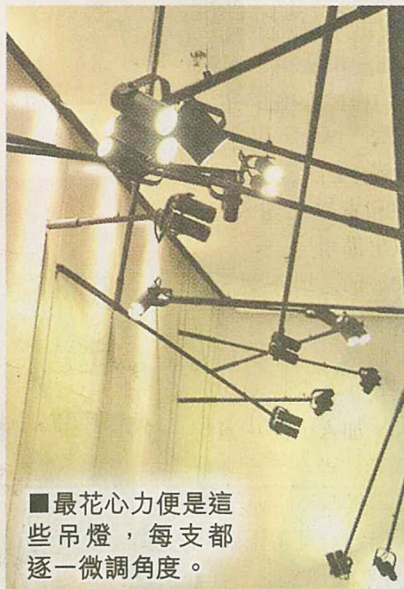
■最花心力便是這些吊燈，每支都逐一微調角度。