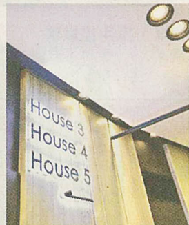
■戲院中每部份，包括每粒字都經過重新設計。