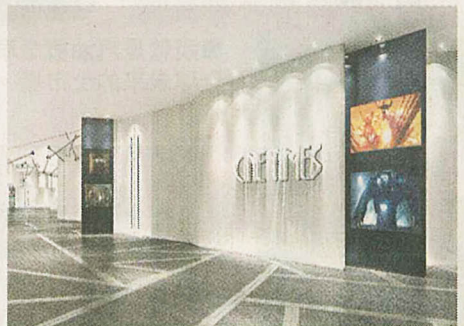
■整個戲院都以簡約黑白作主調，再利用各細節配置，打造濃厚電影感。