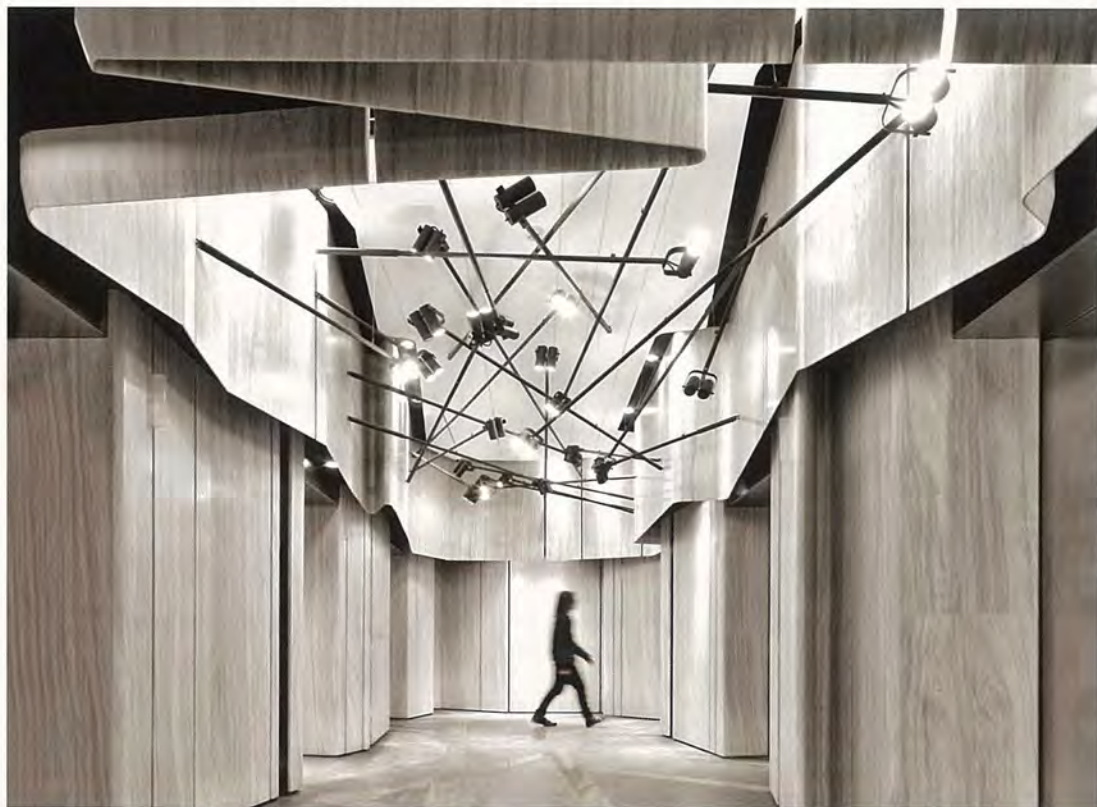
香港时代广场的UA影院以胶卷为设计灵感。

香港的客户会要求比较高雅的设计，反而内地的客户会让我们随性地设计，发挥想象，因为我们的设计都比较大胆，追求突破，内地现在的顾客反倒比香港的顾客更能接受我们的这种风格，也愿意给我们的设计自由的空间，我们一些比较大胆创新的设计大多是在内地。