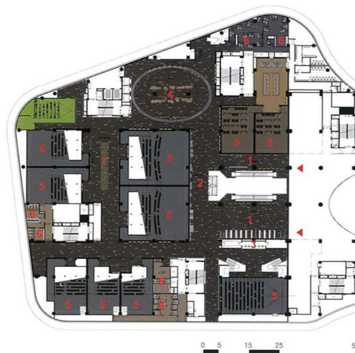
7th Floor plan

Inside this cinema, everyone would enjoy the great atmosphere of digital world generated by the cohesion of all "Pixel" elements.