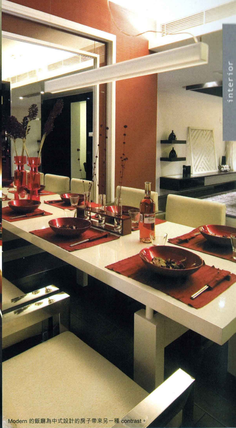
Modern 的飯廳為中式設計的房子帶來另一種 contrast。