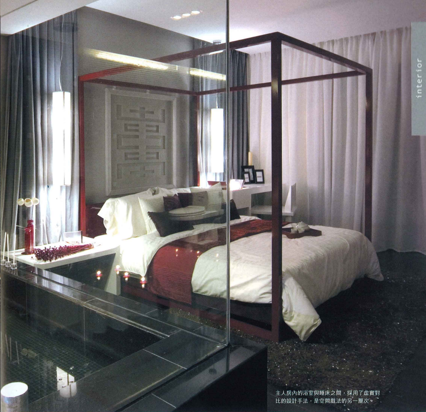
主人房內的浴室與睡床之間，採用了虛實對比的设计手法，是空間戲法的另一層次。