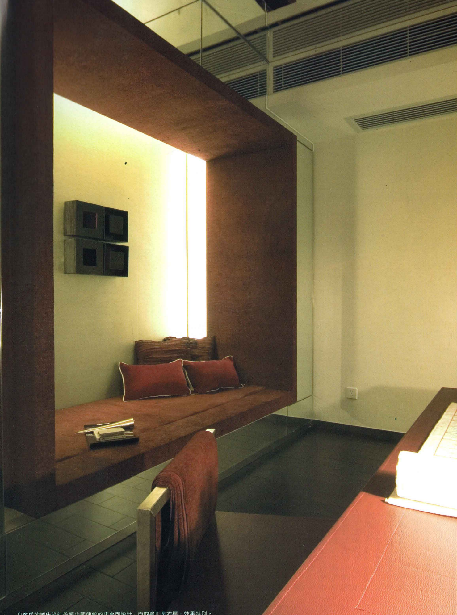
臥室的睡床設計依照中國傳統的床台而設計，而四邊則是衣櫃，效果特別。