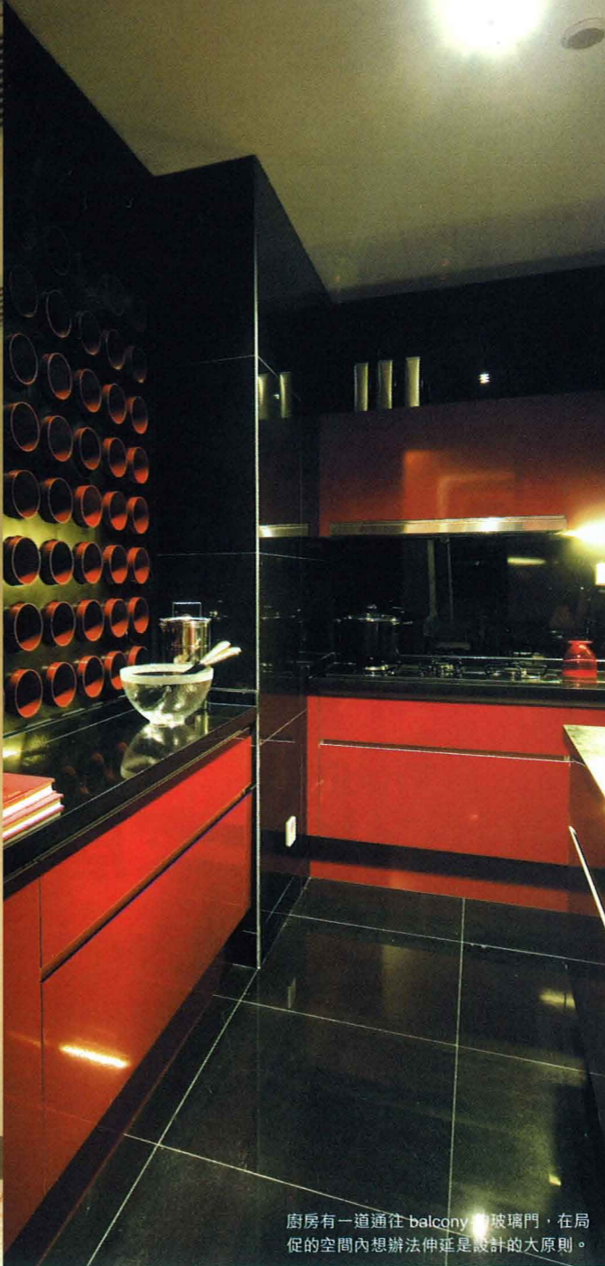
廚房有一道通往 balcony 的玻璃門，在局促的空間內想辦法伸延是設計的大原則。